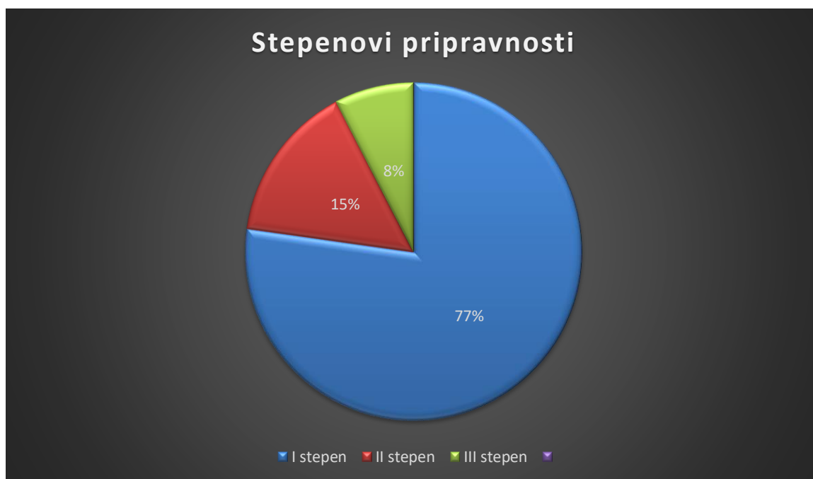
Slika 2. Stepenovni pripravnosti